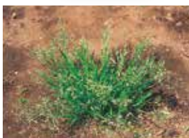
スズメノカタビラ