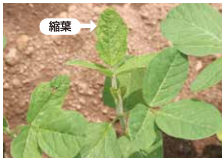
エンレイ：2~3葉期処理(処理3日後)