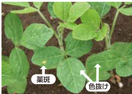
エンレイ：2~3葉期処理(処理7日後)