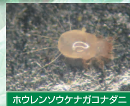
ほうれんそうケナガコナダニ